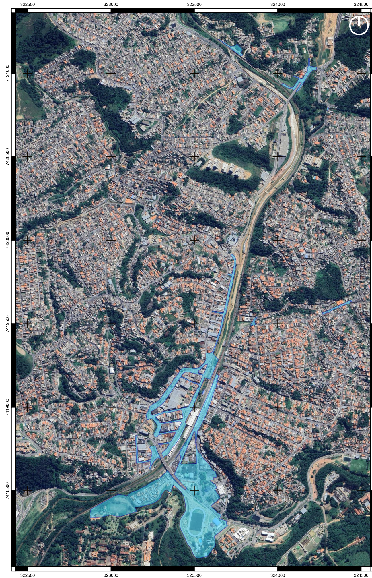
Alagamentos ao longo do Rio Juqueri escala 1:13.000