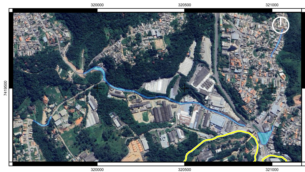
Alagamentos ao longo da Av. Pacaembu escala 1:11.000